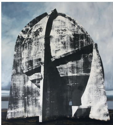
Clément Laigle, Pal , 2015, acier brut, béton, 650 x 40 x 40 cm © Clément Laigle, Courtesy the artist and galerie Gourvennec Ogier

Located on the Villejean campus of Rennes 2 University, The Gallery Art et Essai, presents, from September to June, 5 major exhibitions focusing either on one artist or a group of artists; some with international recognition, others as project rooms featuring specific propositions. Working with the Department of Culture of the University, the Gallery Art et Essai is a venue for exhibitions, professional training, as well as a place dedicated to research and exchanges. The Gallery Art et Essai is part of the Network for Contemporary Art in Brittany.