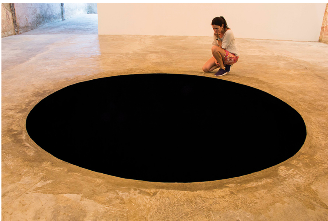
Anish Kapoor, Descent into Limbo, Havana, 2016

Vineri, 7 decembrie, h 15:00-19:00 Colegiul Noua Europă (Plantelor 21)